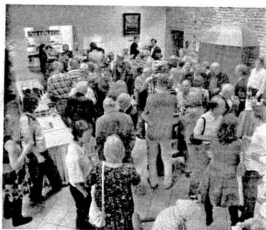
* De feestvierders in de schitterende zaal van de schuilkerk behorend bij het complex 'De Driehoek' (foto's Wim van der Hout).